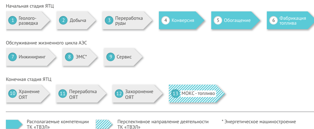
Рис. 1. Место ТК «ТВЭЛ» в ядерном топливном цикле

пожарной, экологической, безопасности условий труда, физической защиты ядерных объектов и готовности к аварийному реагированию. ТК «ТВЭЛ» занимает основное место в структуре Госкорпорации «Росатом» на начальной стадии ядерного топливного цикла.